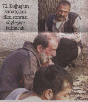
72. Koşuş'un sanatçıları film sonrası söyleşiye katılacak.